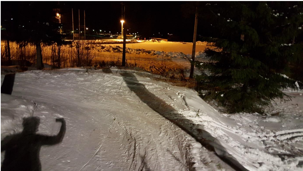
Bild på velodromkurva som är tänkt att ingå i Ski-Cross sprintbana