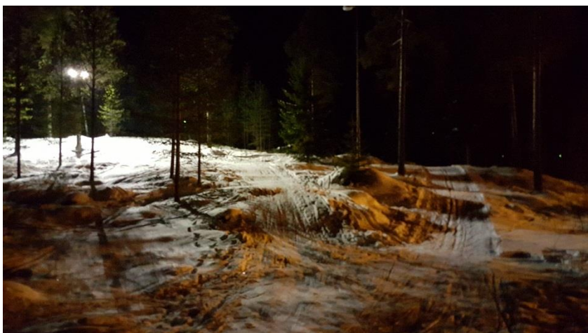
Bild tagen nedanför skidlekplatsen närmast grusplanen