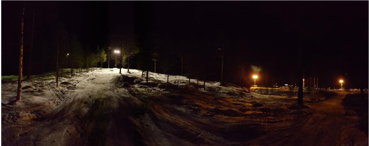
Bild tagen nedanför skidlekplatsen närmast saxbacken.

Bilder från Skidlekplatsen efter slutförandet av Fas 1